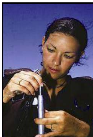
Vorbereitung der Kennzeichnung