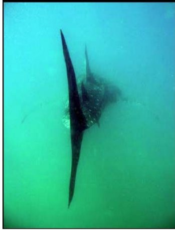
Walhai schwimmt in die Tiefe