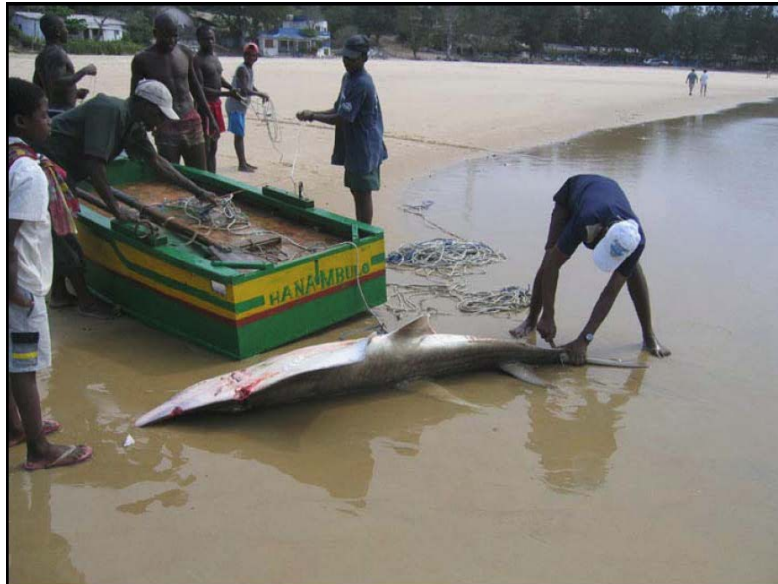
Das illegale Fischen bedrohter Arten, wie dieser Gitarrenfisch, ist mittlerweile in Tofo Beach eingestellt, dank der Arbeit des Manta Ray & Whale Shark Trust