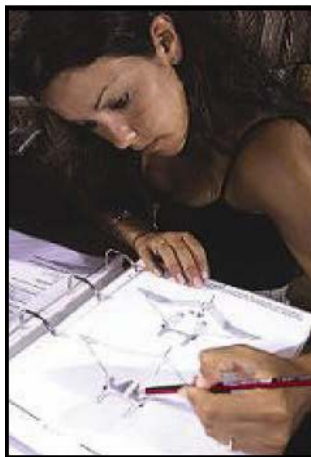
Skizzen von identifizierten Mantas