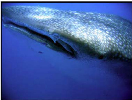
Walhai und Pilotfisch