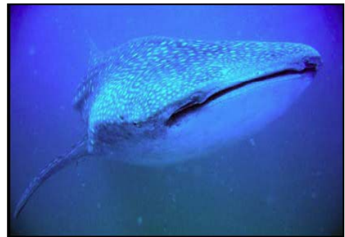
Annäherung eines Walhais