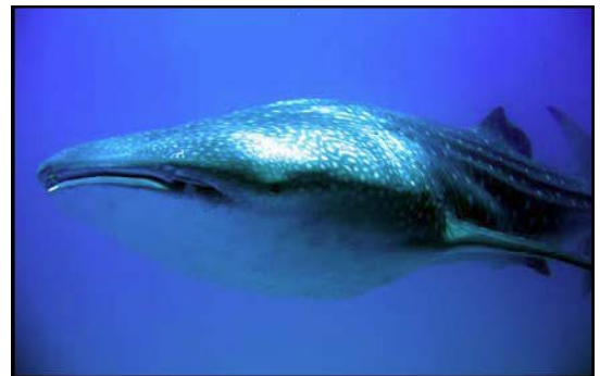
Walhai mit Verletzung an der Rückenflosse