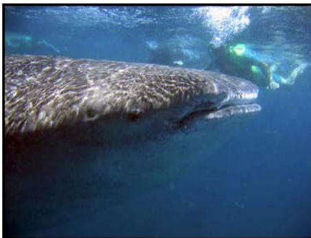
Walhai und Tourist