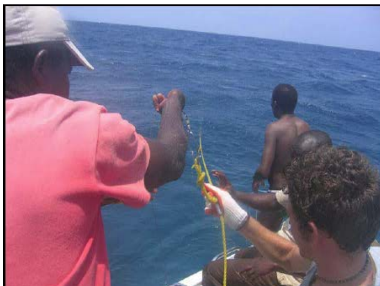
Angestellte des Fischereiministeriums und der maritimen Behörden arbeiten mit dem Manta Ray & Whale Shark Trust zusammen, um illegale Fischereiausrüstung zu beschlagnahmen